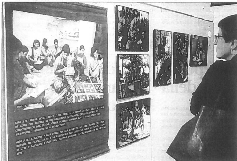
La exposición está formada por 50 fotografías cedidas por el Comité Español de ACNUR.

Simon Chapman PROFESOR EMÉRITO DE LA UNIVERSIDAD DE SYDNEY