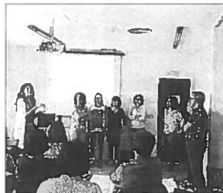
Una de las sesiones de formación realizadas.

► Un total de 40 profesionales del ámbito sanitario, educativo y social de Menorca han participado en los talleres formativos del Centro Coordinador de Atención Primaria para el Desarrollo Infantil del Servicio de Salud. La iniciativa busca potenciar la atención a los menores con trastornos de desarrollo y a sus familias con una mejor coordinación entre profesionales.